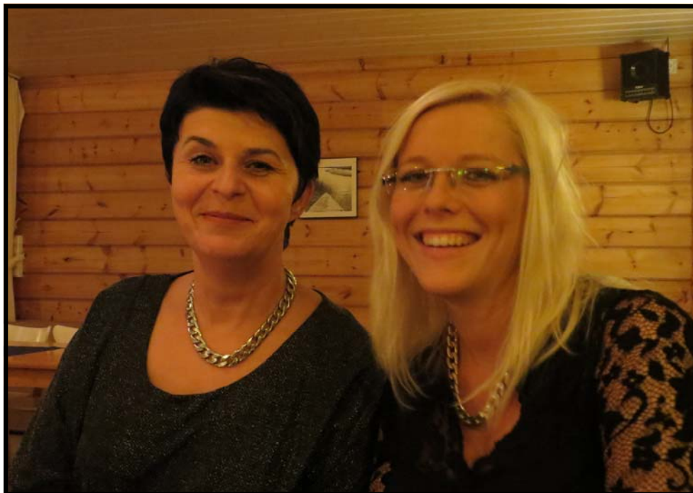
Alma till vänster på bilden

Pörtom nytt är ett elektroniskt nyhetsbrev som utkommer ca 3 gånger per år.